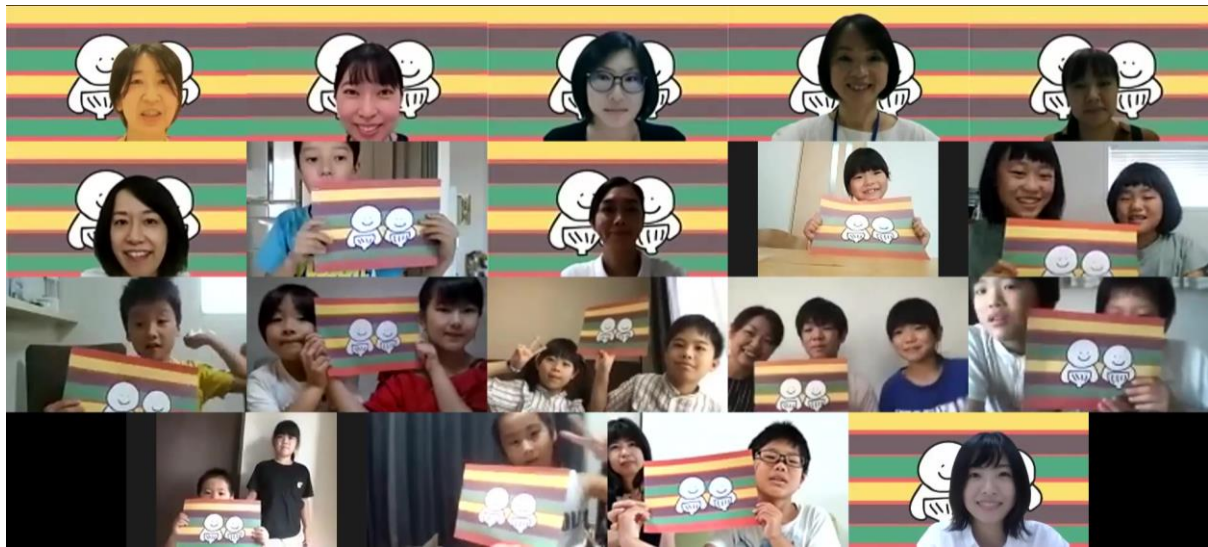
▲ご参加いただいた皆さんと記念撮影

今回は、公式メールマガジン・Instagram よりご応募いただいた方の中から抽選で当選した11組のご家族にご参加いただきました。社員考案のアレンジレシピ試食やクイズを交え、忙しい朝の新提案、「めざまし茶づけ」をはじめのきっかけを楽しく学んでいただきました。