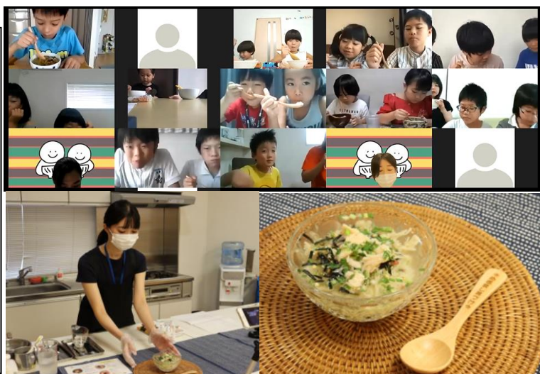
▲ママ社員おすすめのアレンジレシピ