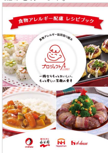
レシピブック表紙