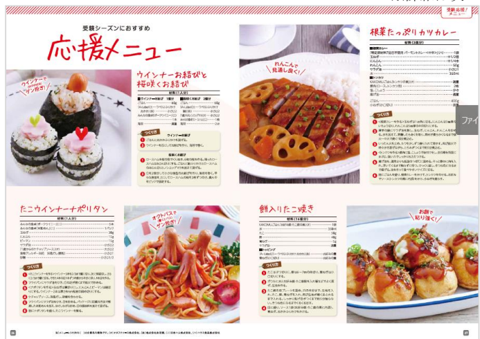
季節のテーマごとに展開するレシピページ