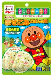
それいけ!アンパンマン ませこみごはんの素 緑黄色野菜