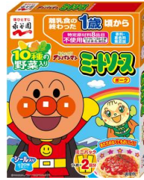
アンパンマンミニパック ミートソースポーク