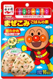
それいけ!アンパンマン ませこみごはんの素 鮭わかめ