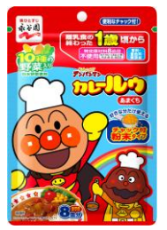
アンパンマン カレールウ