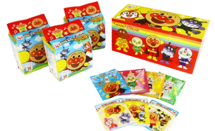
アンパンマンふりかけ 60食