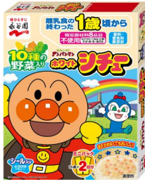
アンパンマンミニパック ホワイトシチュー