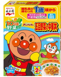
アンパンマンミニパック 五目野菜の中華丼