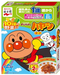
アンパンマンミニパック ハヤシポーク