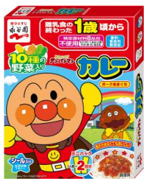
アンパンマンミニパック カレーポーク あまくち