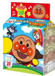
それいけ!アンパンマン ふりかけ ミニパック