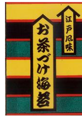
発売当初のパッケージ