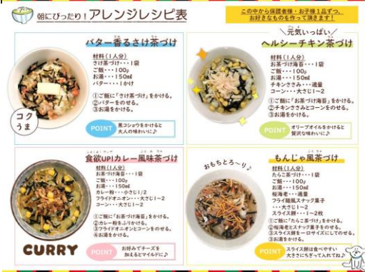
▲バター香るさけ茶づけ、ヘルシーチキン茶づけ が人気でした