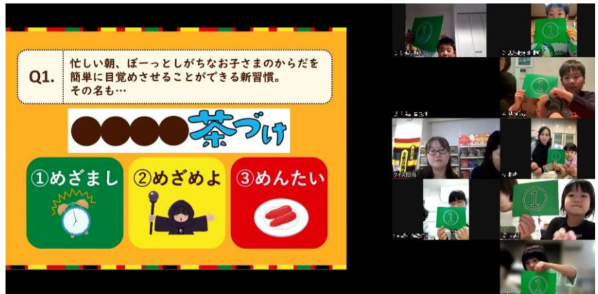
▲積極的に回答いただき盛り上がりました