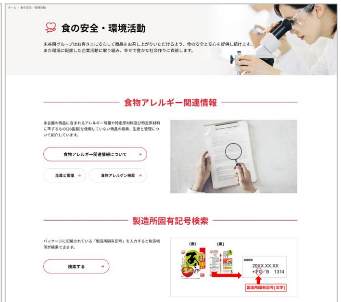
▲永谷園「食の安全・環境活動」ページ(一部)