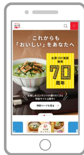
▲永谷園ホームページ ( https://www.nagatanien.co.jp/ ) トップページ(左:PC デザイン、右:スマートフォンデザイン)