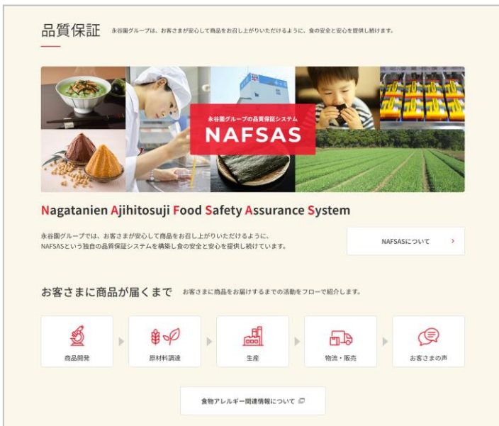
▲永谷園ホールディングス「品質保証・CSR」ページ(一部)

また、永谷園ホームページでは「食の安全・環境活動」コンテンツにて、NAFSAS の紹介の他、食物アレルギー関連情報や永谷園商品に関するトピックスについてもご紹介しています。