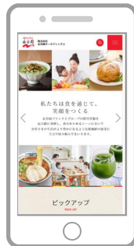
▲永谷園ホールディングスホームページ ( https://www.nagatanien-hd.co.jp/ ) トップページ(左:PC デザイン、右:スマートフォンデザイン)