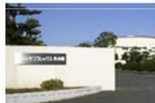
(株)サンフレックス永谷園