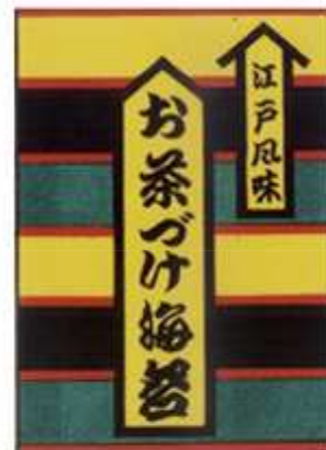
発売当時の「お茶づけ海苔」