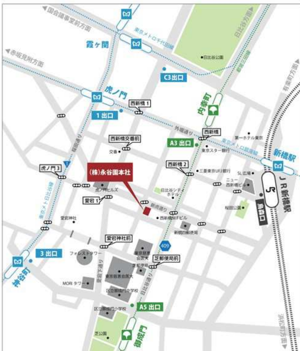
この地図は、2014年04月末時点のもので、建物名などが変わっている場合がありますのでご了承ください。