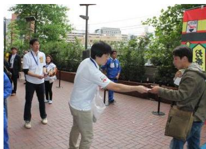
【ベイスターズ: 社員によるサンプリング】