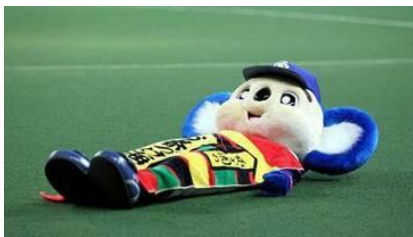
【ドラゴンズ: イベント当日はドアラとコラボ】