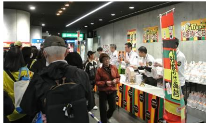
【ファイターズ: 抽選会の様子】