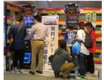
【ベイスターズ: jubeat Qubell 体験ブース】