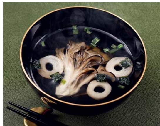
▲「焼ましたけのお吸いもの」調理例